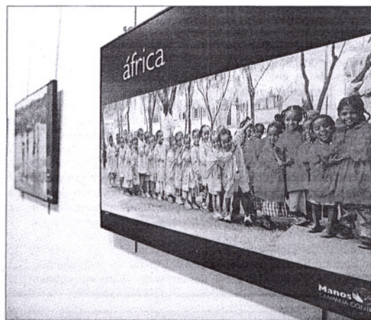
La exposición puede visitarse en la Biblioteca Pública.

Mañana se inaugura en la Sala de Caja España la exposición de artesanía y manualidades, que estará abierta al público hasta el 26 de septiembre. Los beneficios obtenidos, así como también los de la tradicional rifa, serán destinados a la financiación de un proyecto en la India para la construcción de un centro de formación profesional para mujeres. El horario de la exposición será de lunes a sábado de 12 a 14 y de 18 a 21