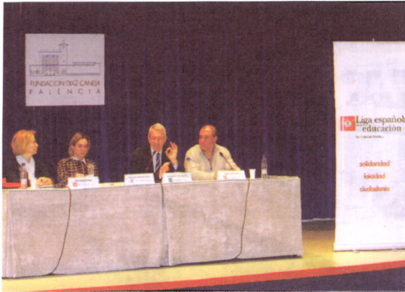
La conferencia inaugural de la 'Escuela de Padres' se celebró ayer en la 'Díaz-Caneja'.

Después de más de veinte años de experiencia en Escuela de Padres, «tenemos la certeza de que es más necesario que nunca educar y formar a padres. Crear lugares de reflexión para que adopten una serie de valores, actitudes y conductas que les sirvan